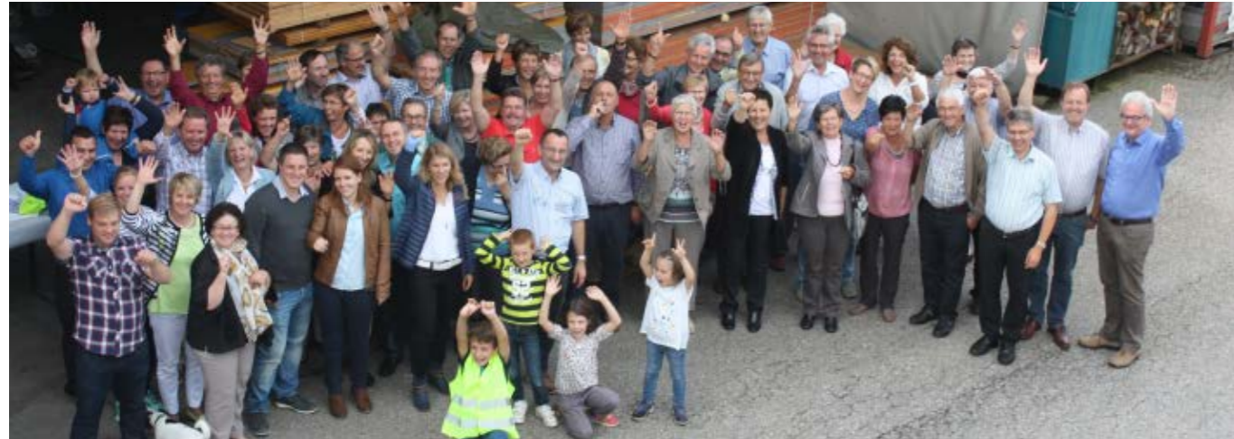
Sommerevent 2015 bei der Orgatent AG.