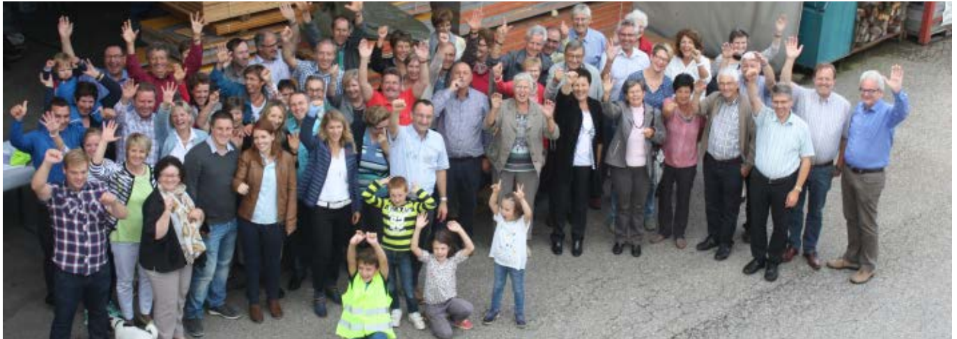
Sommerevent 2015 bei der Orgatent AG.